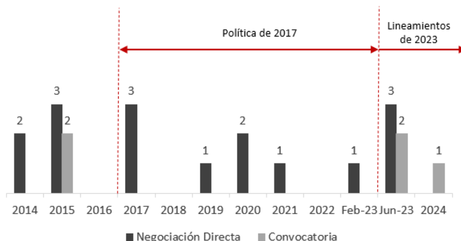
Figura 3: Número de contratos de licencia suscritos para la exploración o explotación de hidrocarburos según tipo de procedimiento de contratación, 2014-2024*

*Nota: La información se encuentra actualizada al 30 de junio de 2024.